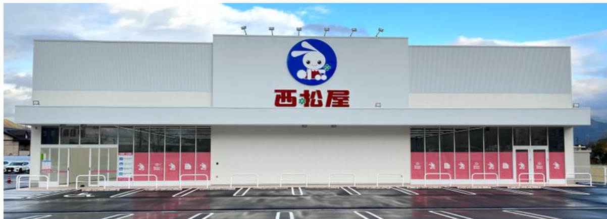
越前たけふ店 (2025年12月開店 福井県)